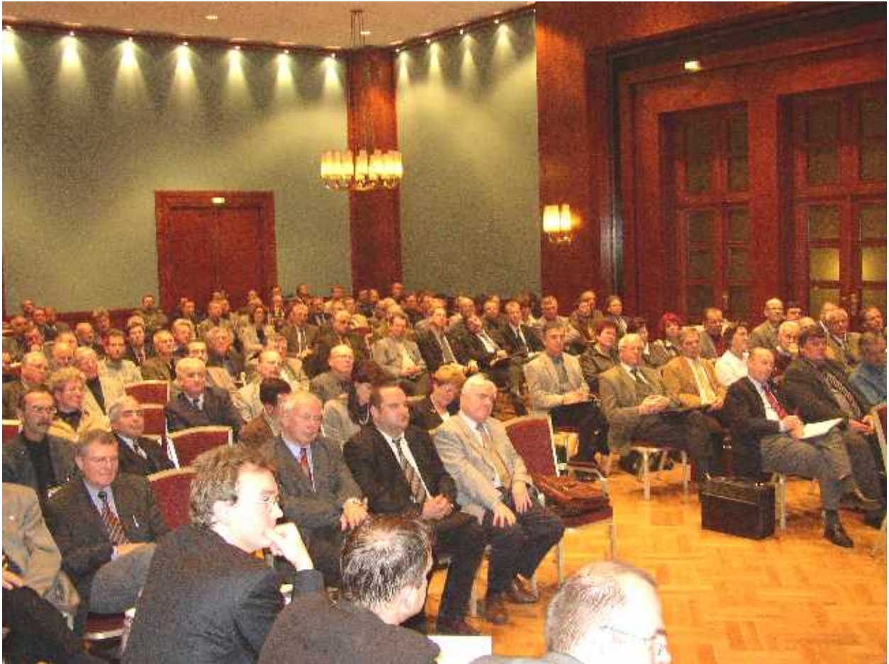
Blick zum Teilnehmerkreis in den Tagungssaal des Chemnitzer Hofes während der Veranstaltung